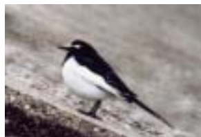
セグロセキレイ（伏見川）