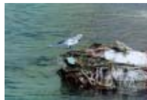
ハクセキレイ（伏見川）