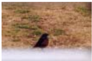
イソヒヨドリ (犀川中流河川敷)