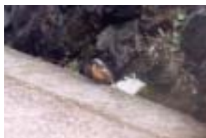
ジョウビタキ (市内、石引町地内)