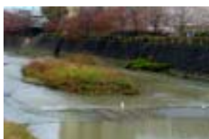
伏見川中流 (米泉小学校付近)