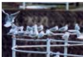
ユリカモメ（伏見川）