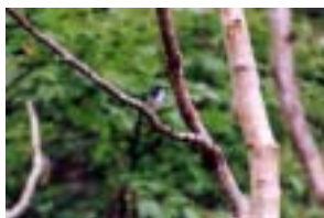
ルリビタキ (兼六園)