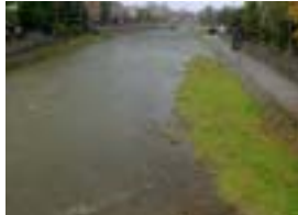
浅野川中流 (天神橋下流)