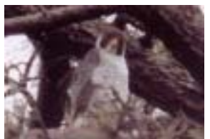
ハヤブサ (普正寺の森)