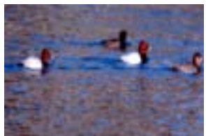
ホシハジロ (犀川、桜橋上流)