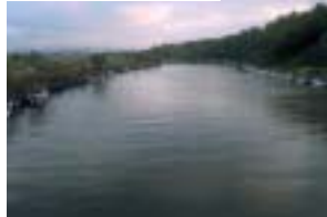
犀川下流 (普正寺町)