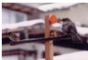
ヒヨドリとスズメ （我が家の餌台）