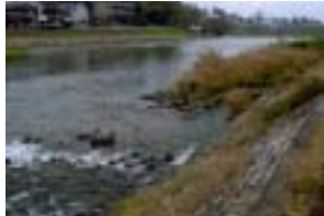
犀川中流 (下菊橋下流付近)