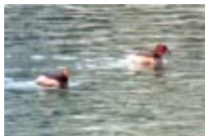
カイツブリ (犀川、桜橋上流)