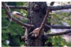
モズのペア (求愛行動、右側をもらったメス)